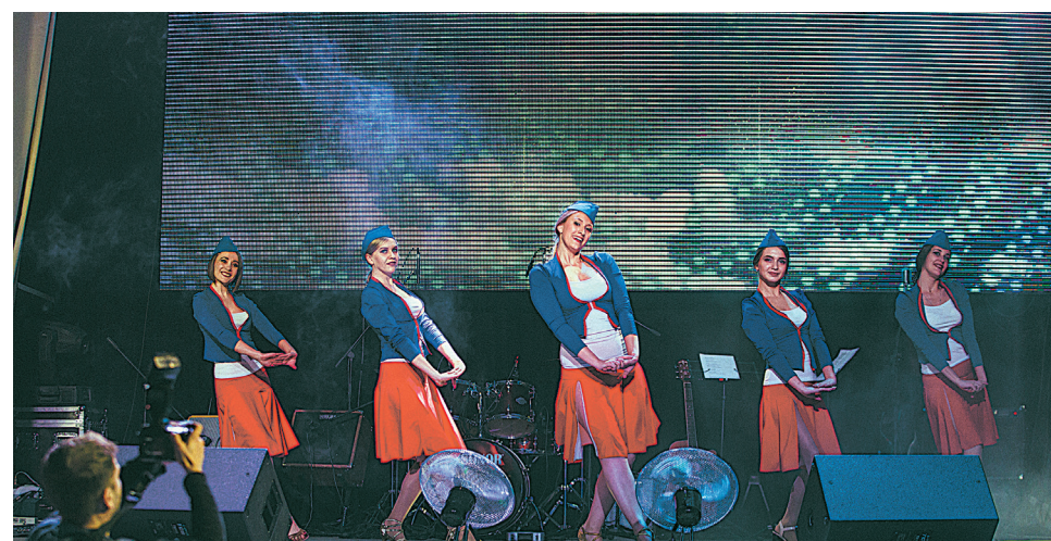
Концертная программа на высоте! А всё потому, что создавали её своими руками. На фото: танцевальный коллектив, в составе - сотрудницы «Азота».