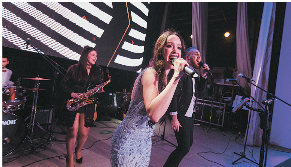
Весь вечер заводчан развлекали стильные музыкальные коллективы. В репертуаре - самая разнообразная и самая позитивная музыка: от джаза до танцевальных хитов. На фото: новокузнецкая кавер-группа «Моjo».