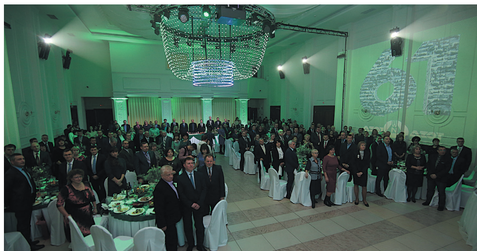
Гимн своего родного завода азотовцы слушают только стоя.